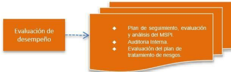
Figura 5. Fase Evaluación Desempeño modelo de seguridad

Evaluar el desempeño y la eficacia del SGSI, a través de instrumentos que