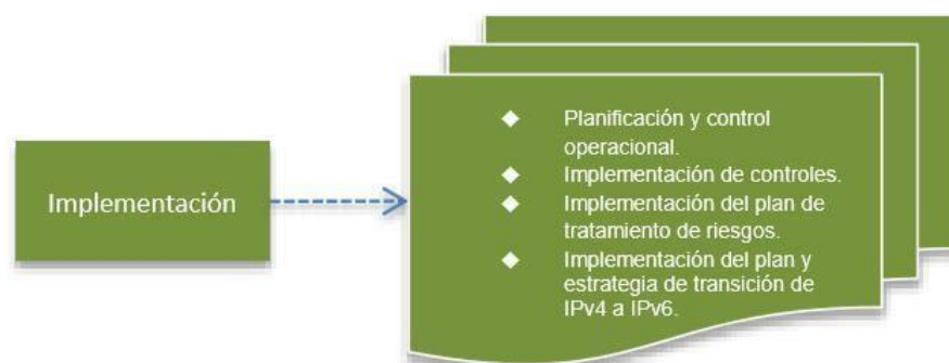
Figura 4. Fase de implementación modelo de seguridad

Llevar a cabo la implementación de la fase de planificación del SGSI, teniendo en cuenta para esto los aspectos más relevantes en los de implementación del Sistema de Gestión de Seguridad