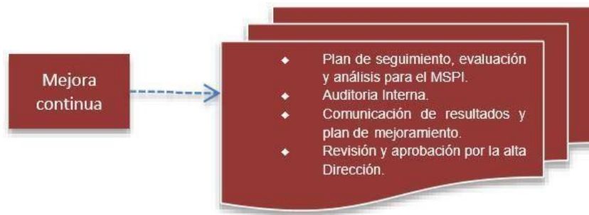
Figura 6. Fase Mejora Continua modelo de seguridad

Consolidar los resultados obtenidos del componente de evaluación de desempeño, para diseñar el plan de mejoramiento y privacidad de la información, que permita realizar el plan de